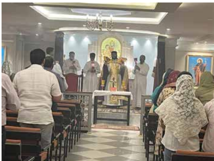
FEAST OF ST.GEORGE AT ARMANIAN CHURCH SALWA