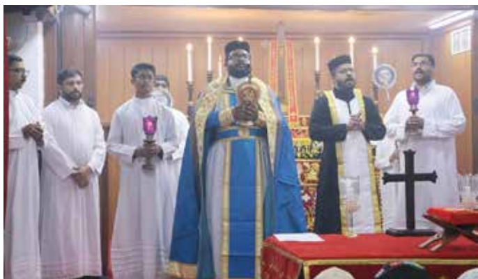
FEAST OF ST.GEORGE AT SHLOMO HALL