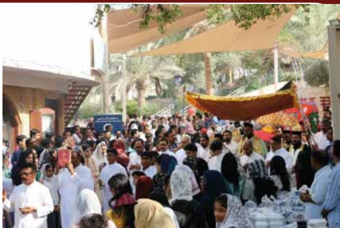
PROCESSION AT NECK