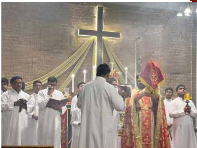
ASCENSION OF OUR LORD AT NECK